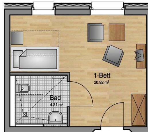
Einzelzimmer, Variante 2